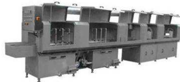
Kasten- und Behälterreinigungsanlagen