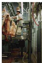
Schlacht- und Zerlegeanlagen