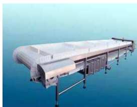
Rollenbahnen, Förderbänder -Anlagen, Zerlegebänder